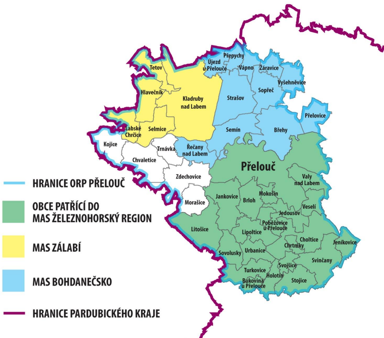
Obrázek 1 Struktura ORP Přelouč dle hranic MAS na území daného ORP

z nichž MAS Železnohorský region (MAS ŽR) zahrnuje nejvíce obcí z daného ORP a má v území nejdelší tradici (působí již od roku 2005). MAS ŽR je v tomto ORP také největší MAS, co se týče počtu obyvatel. 1