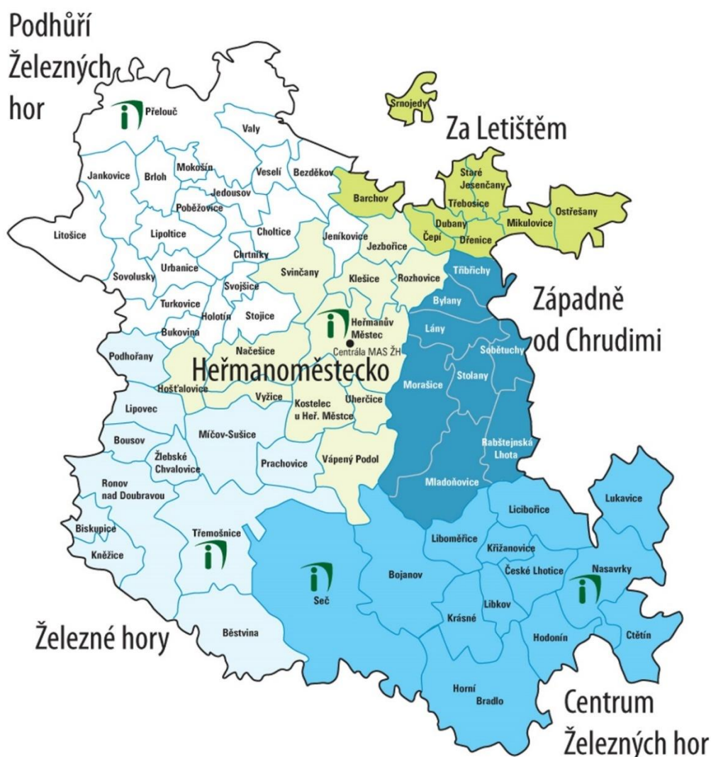
Obrázek 3 Území MAS Železnohorský region s dobrovolnými svazky obcí (DSO)

MAS Železnohorský region (MAS ŽR) byla založena v roce 2005 s právním statutem občanského sdružení. Od roku 2015 je MAS ŽR zapsaným spolkem. Sídlo MAS ŽR je v Multifunkční budově (kde sídlí také Informační centrum) v Heřmanově Městci. V současné době se území MAS ŽR rozkládá na území 6 svazků obcí (Heřmanoměstecko, Centrum Železných hor, Podhůří Železných hor, Za Letištěm, Západně od Chrudimi a Železné hory) a 1 obce Licibořice (viz níže mapa MAS Železnohorský region s dobrovolnými svazky obcí). Území má celkem 72 obcí a celkově kolem 45 tisíc obyvatel – z nichž na území ORP Přelouč se jedná o počet obyvatel 11 387, což představuje 44 % všech obyvatel ORP Přelouč (celé ORP Přelouč má celkem 25 990 obyvatel k 31. 12. 2020).