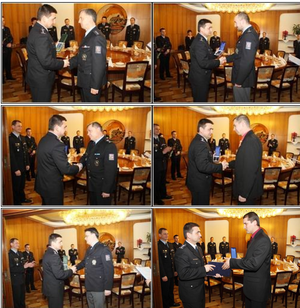
Policejní prezident udělil medaili Za statečnost a Za zásluhy o bezpečnost v souvislosti s neštěstím ve Frenštátu pod Radhoštěm